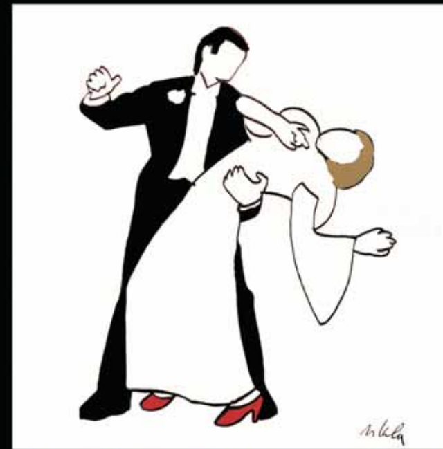
"Musical", tecnica mista e smalti su tela, cm 80x80