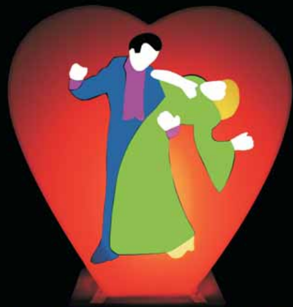
"Cuoricino", 2008, perspex e neon, cm 42x40x12