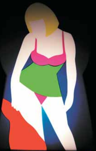
"Pin up", 2008, perspex e neon, cm 47x32x12