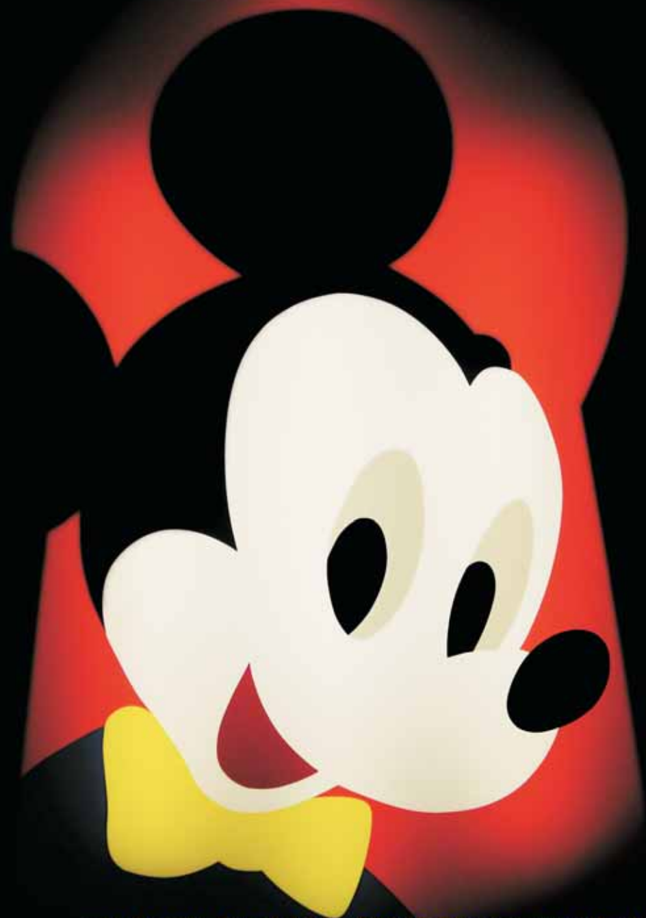
"Mickey" perspex e neon cm 125x84x12

via Stagio Stagi 102 - 55045 Pietrasanta (Lu) Tel./Fax (+39) 0584 791931 - Mob. (+39) 348 9023679 info@tempioarte.com - www.tempioarte.com