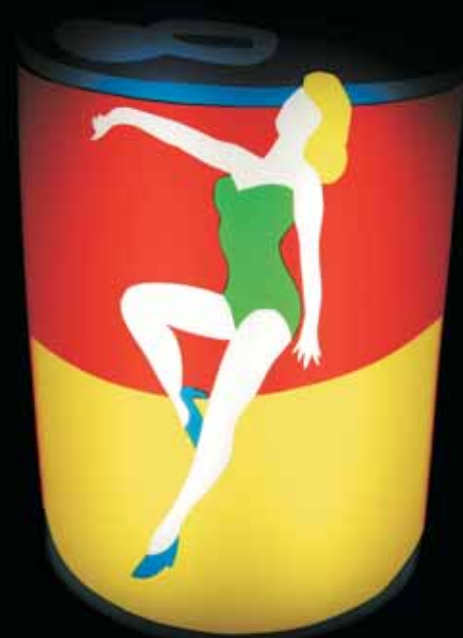
"Campbell", 2006, perspex e neon, cm 70x41x12