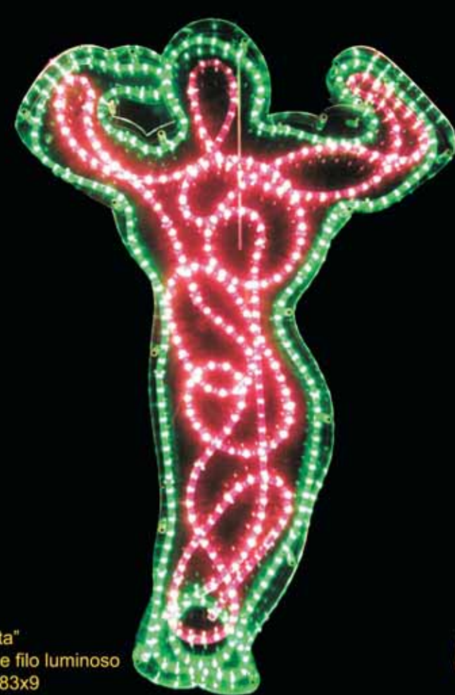
"Culturista" perspex e filo luminoso cm 129x83x9