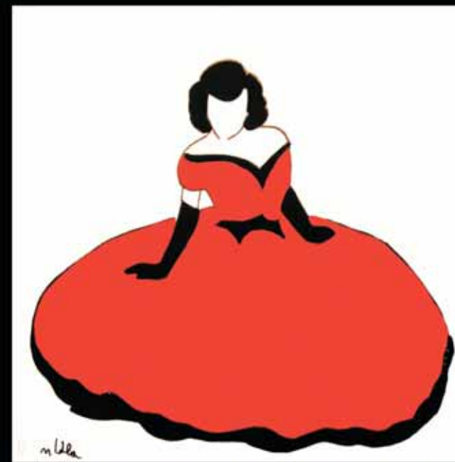
"Diva", tecnica mista e smalti su tela, cm 80x80