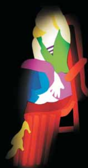
"Pin up", 2005, perspex e neon, cm 147x64x12