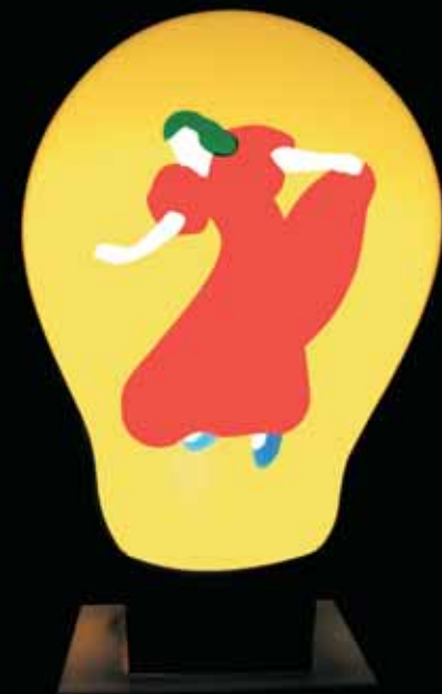
"Lampadina", 2008, perspex e neon, cm 47x29x12