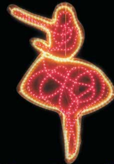
"Ballerina", perspex e filo luminoso, cm 134x75x9